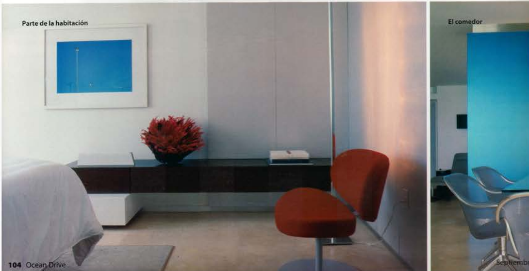
Parte de la habitación

René piensa que la relación con los clientes es esencial para poder interpretar óptimamente sus deseos y los propios. Colaborando juntos en el diseño, nació esta idea de crear un sitio moderno para ir de vacaciones.