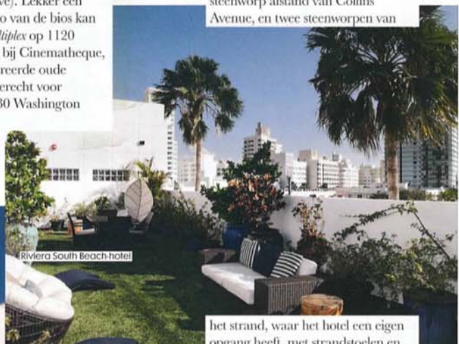
Riviera South Beach hotel

In het Riviera South Beach hotel (2000 Liberty Avenue) heb je eigenlijk je eigen appartement vlak bij het strand, en het is qua locatie de perfecte uitvalsbasis voor bovenstaande tips. De grote (veertig vierkante meter!) frivole kamers zijn fashionable ingericht (denk: een Marni-palet) en hebben een aparte slaapkamer en een volledig ingerichte keuken. Het is easy en intiem, en (tip!) de door boys maken ook een mean cappuccino. Het hotel ligt op een steenworp afstand van Collins Avenue, en twee steenworp van