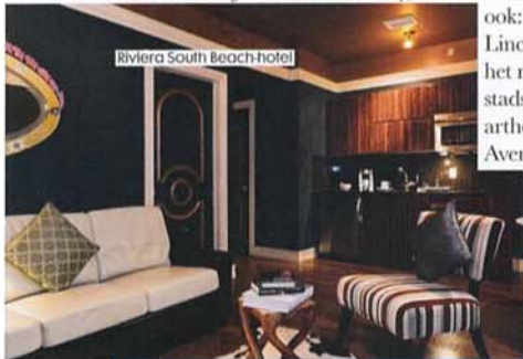
Riviera South Beach hotel

dan is er de 11th Street Diner, in een authentieke art deco diner car (op de hoek van 11th Street en Washington Avenue), en de beste snackbar ever : de Shake Shack, beroemd om de biohamburgers en custard milkshakes (1111 Lincoln Road). Een must (als de 'r' in de maand is) is Joe's Stone Crab, beroemd om de krab dus, en hun Key lime pie (11 Washington Avenue). Voor livemuziek kun je elke avond terecht bij Van Dyke (846 Lincoln Road), wil je borrelen of dineren met een view, dan is er het penthouse van Juvia (1111 Lincoln Road), voor ouderwetse sleazy disco kun je naar de Rec Room (in de kelder van het Gale South Beach hotel, 1690 Collins Avenue) en wil je gewoon een no-nonsense dive bar : Club Deuce (222 14 th Street). En South Beach heeft ook hipsters! Die vind je in The Broken Shaker speakeasy in het nieuwe Freehand Hostel (2727 Indian Creek Drive). Lekker een avondje in de airco van de bios kan ook: er zit een multiplex op 1120 Lincoln Road, en bij Cinematheque, het mooi gerestaureerde oude stadshuis, kun je terecht voor arthousefilms (1130 Washington Avenue).