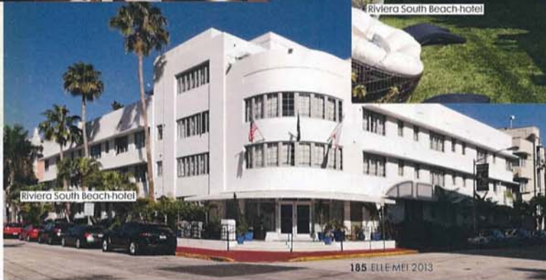
Riviera South Beach hotel

het strand, waar het hotel een eigen opgang heeft, met strandstoelen en parasols. Wuivende palmen voor het raam, gratis cocktails van zeven tot acht in de Catalina Beach Club, wat wil een mens nog meer? ← Zie voor meer info over het Riviera South Beach hotel: www.rivierahotelsouthbeach.com